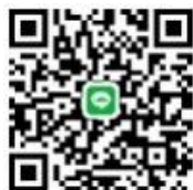
西予市立西予市民病院 1

「西予市立西予市民病院1」をLINEに友だち追加をしてください。 LINEの友だち追加で下のQRコードを読み取ってください。