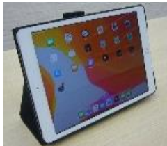
病院所有のタブレット