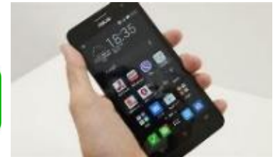
面会される方の スマホ・タブレット

面会される方のスマホ・タブレットの通信 料金は、面会される方の負担となります。 Wi-Fi環境での利用をお願いします。